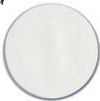
1. kirkas, sileä lasi