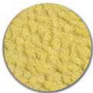
3. keltainen kuviolasi