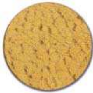
4. pronssinsävyinen kuviolasi