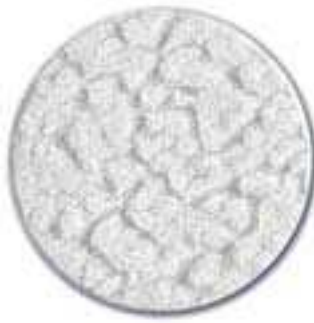
2. kirkas kuviolasi