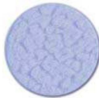
5. sininen lasi

Lasi kiinnitetään lyhtykehukseen ruuvi kiinnitteisesti, jolloin tarvittaessa lasi on helposti vaihdettavissa.